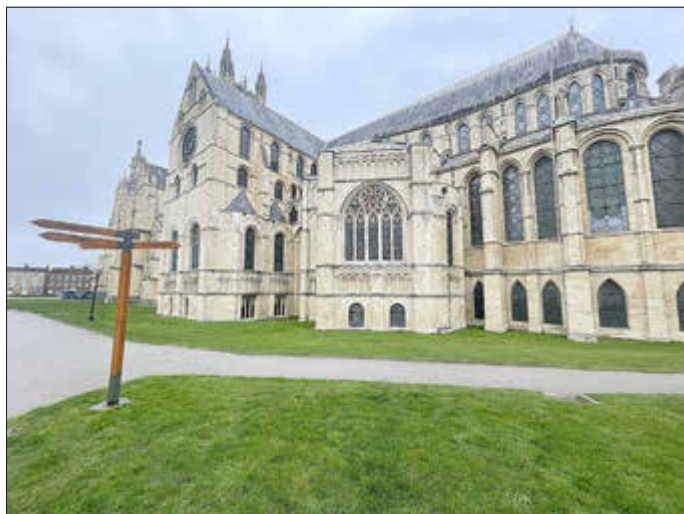
The Cathedral of Christ Church in Canterbury, England

Auch in diesem Jahr reisten die 9. Klassen im Rahmen der Studienfahrt wieder nach England und erlebten dort eine abwechslungsreiche, spannende und sonnige Woche mit vielen kulturellen und historischen Highlights.