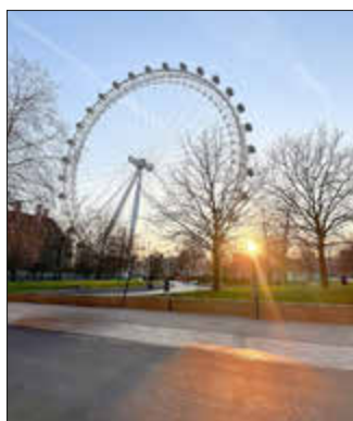
Blick auf das 135m hohe London Eye am Südufer der Themse

Ein erster Höhepunkt der Reise war der Besuch der historischen Stadt Canterbury. Dort konnten die Schülerinnen und Schüler die beeindruckende Kathedrale besichtigen und erhielten Einblicke in die Geschichte der Stadt, die eine bedeutende Rolle in der englischen Kultur spielt. Anschließend blieb noch Zeit, die charmanten Gassen mit ihren kleinen Geschäften zu erkunden. Ein weiteres Ziel war die traditionsreiche Universitätsstadt Cambridge. Bei einem Rundgang konnten die Teilnehmenden die berühmten Colleges anschauen, die Zeitfresser-Uhr bestaunen und mehr über das Leben an einer der bekanntesten Universitäten der Welt erfahren. Besonders die malerische Umgebung entlang des Flusses Cam hinterließ einen bleibenden Eindruck. Überdies nahmen die Jugendlichen an einem Cricket-Workshop teil, bei dem sie die Grundlagen dieses in England sehr beliebten Sports kennenlernten und sich selbst im Schlagen und Werfen ausprobieren konnten - eine ganz neue und spannende Erfahrung!