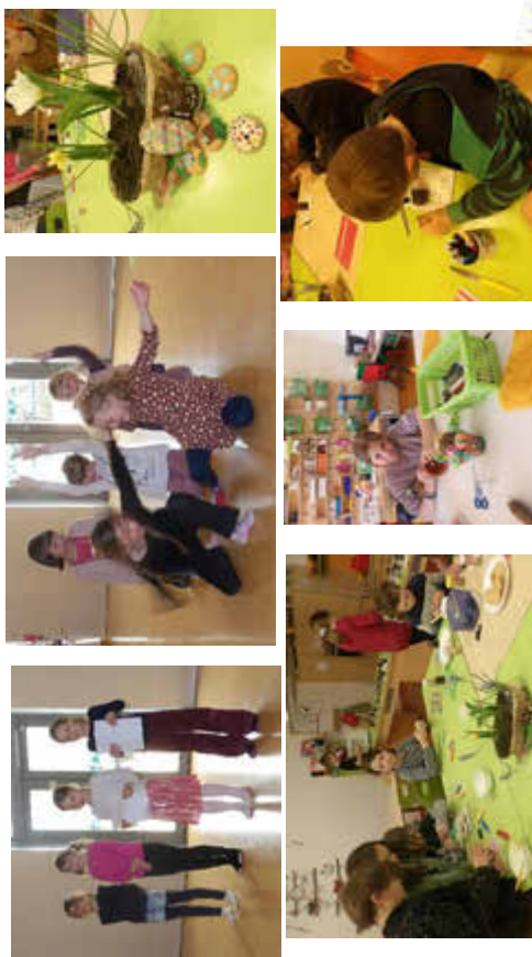
ÜBERRASCHUNG...der Osterhase hat etwas für uns im Garten versteckt.

Das Highlight der Osterwoche war unser fröhliches Osterprogramm. Kleine Hasen aus der 1.Klasse begeisterten das Publikum mit einem Ostertanz. vier Schauspielerinnen aus der 3. Klasse spielten eine lustige Geschichte über „Die verlorenen Ostereier“. Des weiteren wurden wir von Frühlingsgedichten und Liedern verzaubert. Zum Abschluss konnten wir die vielen Leckereien aus der Backwerkstatt genießen und entspannt in die Osterferien starten.