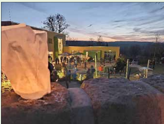
Kerzenschein im Garten