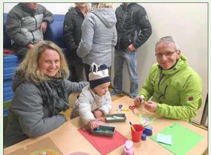
Groß und Klein beim Basteln