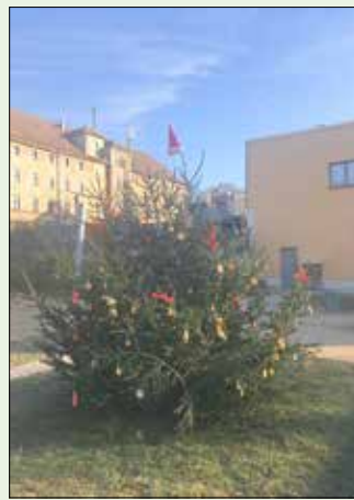
Der geschmückte Weihnachtsbaum der Kinder

Immer am ersten Freitag im Dezember findet im Kinderhaus das Lichterfest für die Kinder und deren Eltern statt. Die Vorbereitungen dafür beginnen schon lange im Voraus. Der Elternrat und die Erzieherinnen beraten bereits im Herbst, was alles angeboten werden kann. Zunächst wurde von den Kindern der Weihnachtsbaum im Freien geschmückt. Am 06.12.2019 war es dann so weit und das Fest konnte beginnen. Mit einem kleinen Programm eröffneten die Kinder des ABC-Clubs das Fest.