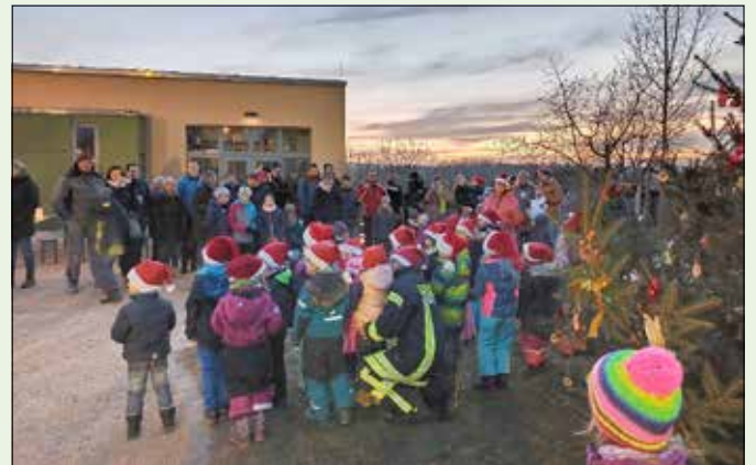
Die ABC-Club-Kinder eröffnen das Lichterfest

Wir möchten uns bei allen Beteiligten, Helfern und Sponsoren für ihre Mithilfe zum Gelingen des Festes bedanken.