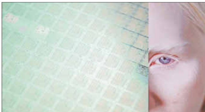
Julia Schmelzer, Stratum , 2023, Ultra HD Video, 16:9, color, sound (still)

Malerei sowie ortsspezifischen und immersiven Installationen aus. Bereits seit 2012 ist sie mit ihren Werken im In- und Ausland auf Ausstellungen vertreten. 2017 ist Julia Schmelzer Mitbegründerin der internationalen Plattform für Medienkunst PYLON, einem digitalen Ausstellungs- und Archivprojekt. Seit 2021 ist sie außerdem als Kuratorin des Ausstellungsraums HYBRID Box im Europäischen Zentrum der Künste HELLERAU tätig.