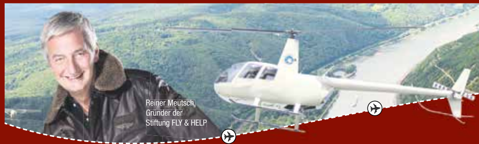
Reiner Meutsch, Gründer der Stiftung FLY & HELP