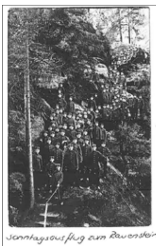
Sonnenhausflug zum Rauenstein

Bedeutsame bauliche Investitionen waren 1893 die Turnhalle und 1897 der Bau des Schulgebäudes.