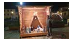
Auch dieses Jahr haben wir die Krippe wieder auf dem Stadtplatz Königstein aufgebaut. Bis zum 06. Januar kann sie dort angeschaut werden