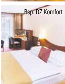
Bsp. DZ Komfort