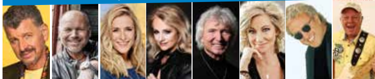
Semino Rossi, Olaf Henning, Stefanie Hertel, Nicole, Peter Orloff, Claudia Jung, Bernie Paul und Graham Bonney

Weitere Infos unter: www.schlager-kanaren.de