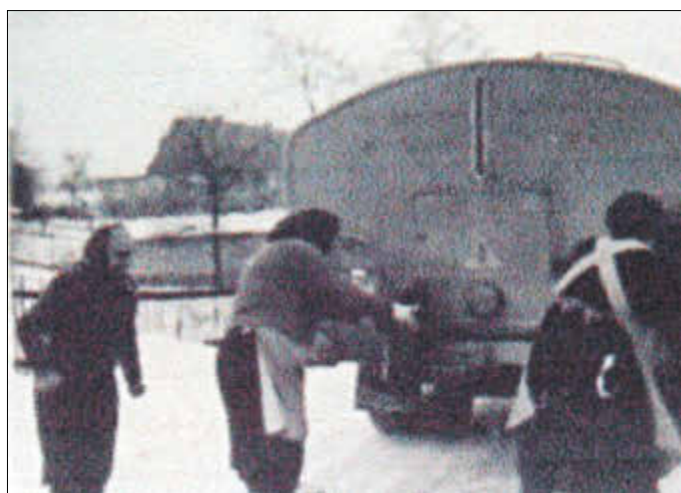
Wasserholen am Tankwagen 1966