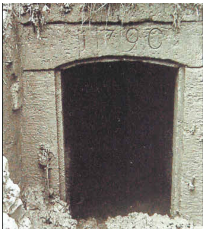
Verschammung der gefassten Quelle, Hochwasser 1957