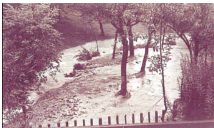
Überschwemmung der anliegenden Grundstücke Hochwasser 1957