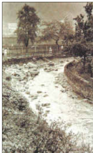
Zerstörtes Bachbett an der Mündung Hochwasser 1957