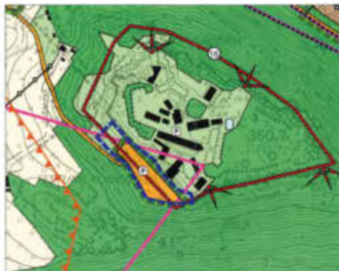
Bisherige Darstellung des Flächennutzungsplanes