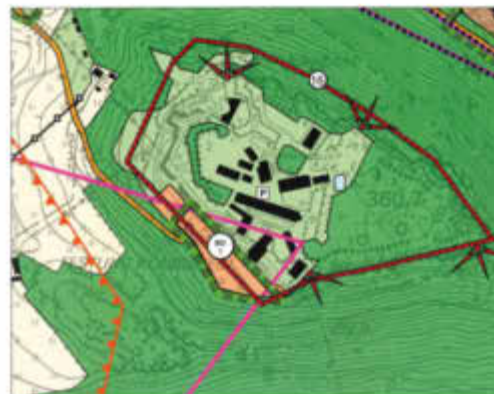
Neue Darstellung des Flächennutzungsplanes im Änderungsbereich