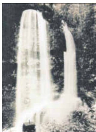
Pehnowasserfall in den Fünfzigern

Die nächste Ausgabe erscheint am: Freitag, dem 28. April 2023