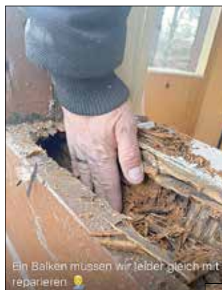
Ein Balken müssen wir leider gleich mit reparieren. 😊